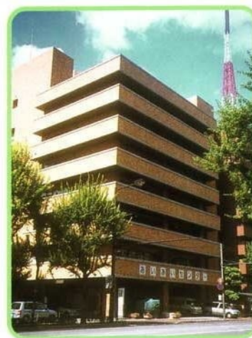
あいあいセンター