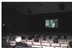
中央市民センターにて