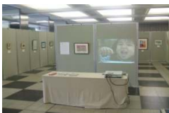
市役所ロビー、地下星の広場にて