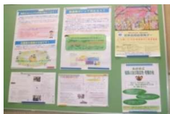
各区役所まちかど文化広場など

世界自閉症啓発デー<公式サイト> http://www.worldautismawarenessday.jp